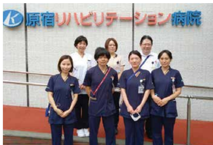
入院支援室 主に入院に関わる業務を担当しています (入院相談や入院調整など)

令和7年1月1日より原宿リハビリテーション病院内に入退院支援センターを開設いたしました。患者さまやそのご家族が安心して入院し、そして退院を見据えた切れ目のない支援を行うこと、退院後も住み慣れた地域でその人に合った生活が送れるようサポートすることを目的としています。入院する前の不安や、入院中の不安、そして退院してからの不安など、患者さまやご家族と共に問題解決できるようお手伝いいたします。お気軽にご相談ください。