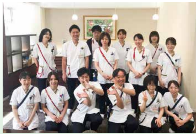
退院支援室 主に退院に関わる業務を担当しています (福祉制度の相談や退院相談など)